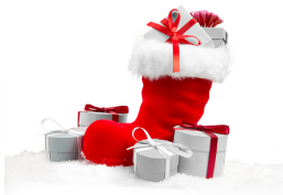
Диана Скок, 6А

Дремлет искрящийся лес, Сверкают хрустальные льдинки. Зима для всех – это время чудес, Это сказок волшебных картинки!