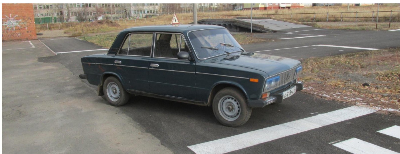
Автомобиль ВАЗ 2106