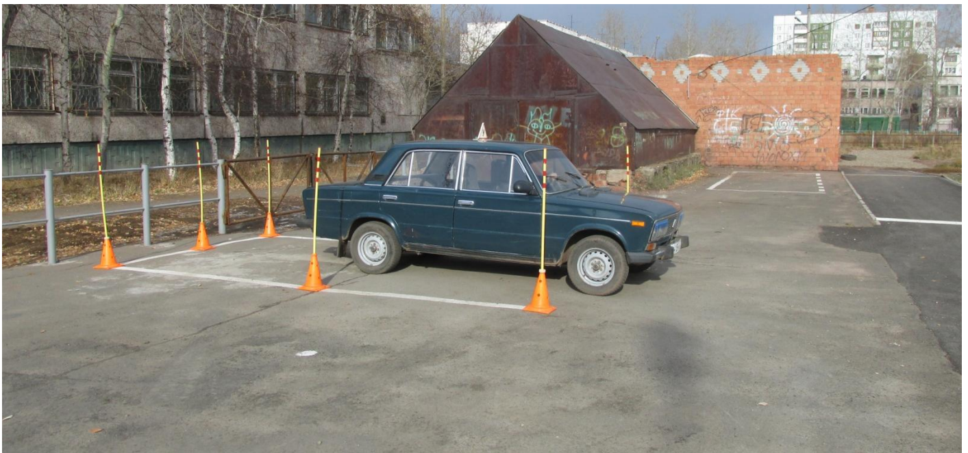
Учебное упражнение «Заезд в ограниченное пространство задним ходом»