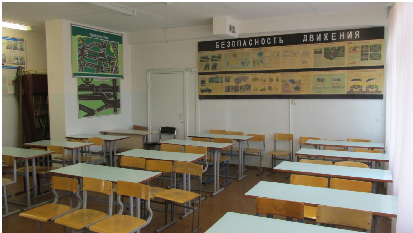
Автокласс для теоретических занятий по программе подготовки водителей транспортных средств категории «В». 30 посадочных мест