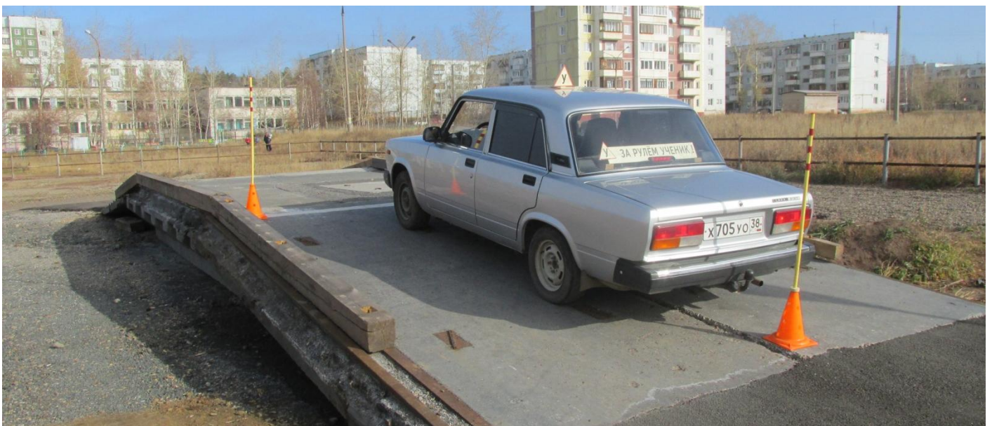
Учебное упражнение «Трогание с места в гору»