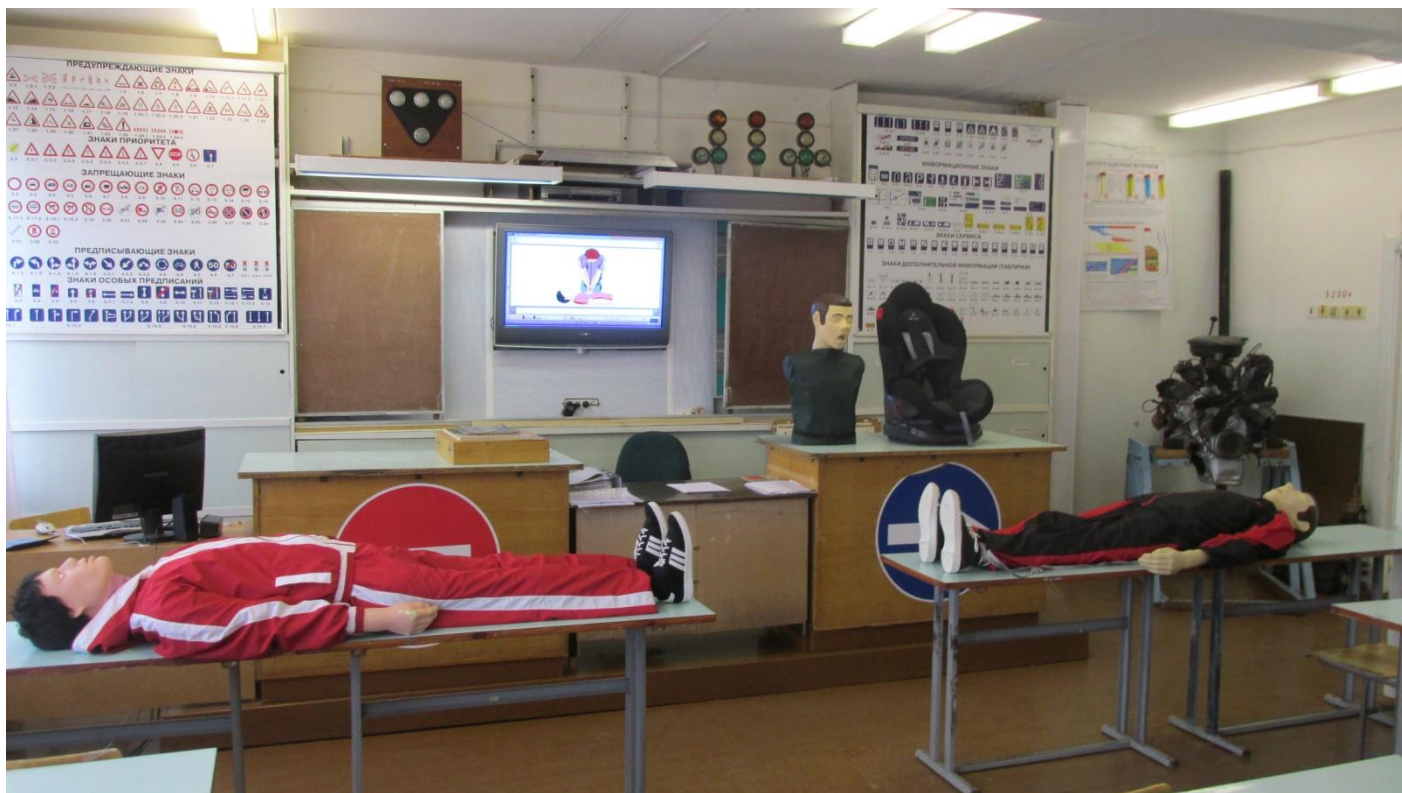
Тренажеры-манекены взрослого пострадавшего Детское удерживающее устройство