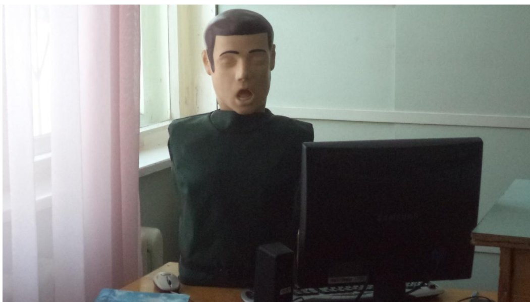
Тренажер-манекен взрослого пострадавшего (голова, торс) без контролера для отработки приемов сердечно-легочной реанимации