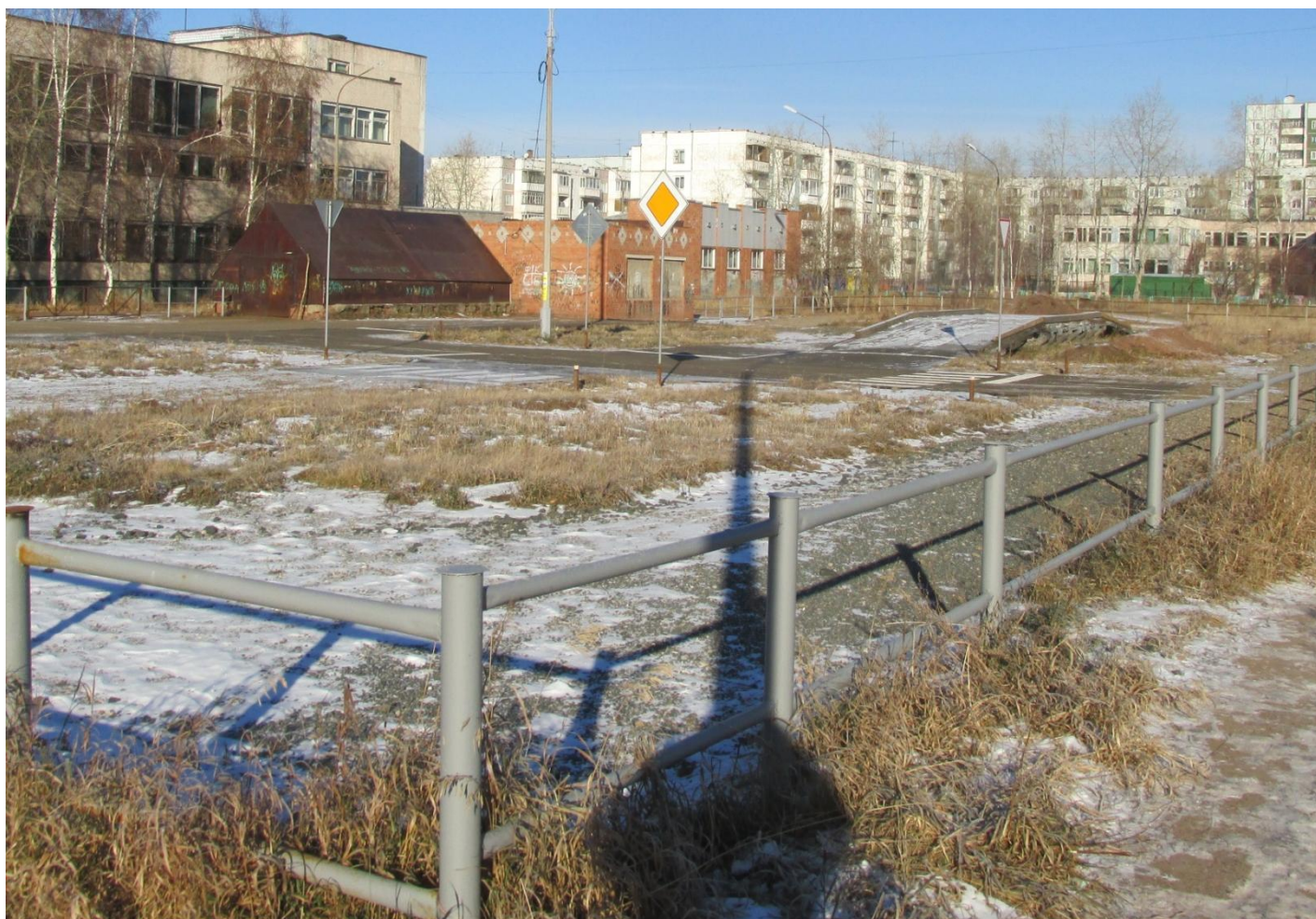
Периметр Закрытой учебно-тренировочной площадки