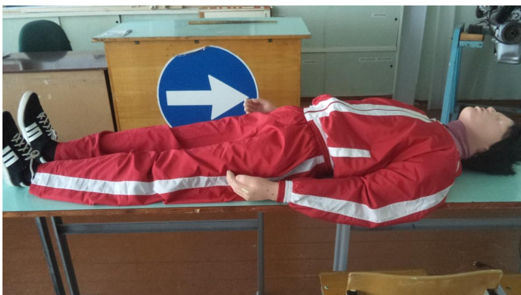
Тренажер-манекен взрослого пострадавшего (голова, торс, конечности) с выносным электрическим контролером для отработки приемов сердечно-легочной реанимации