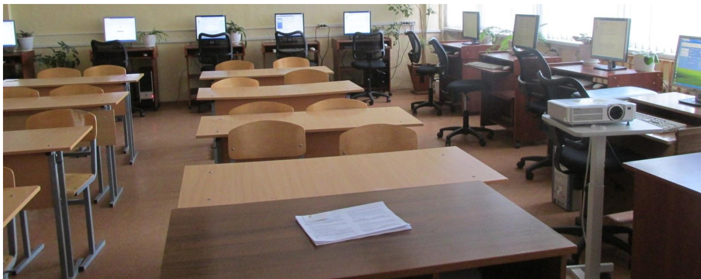
Кабинет информационных технологий № 27. Программное обеспечение «Теоретический экзамен в ГИБДД (сетевая версия)». 15 рабочих мест