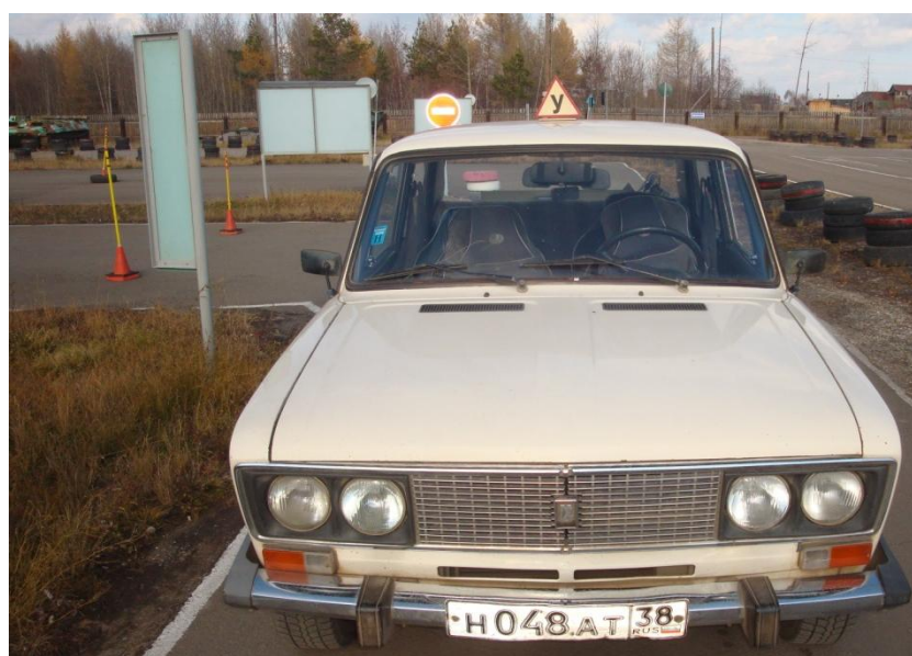
Автомобиль ВАЗ 21061