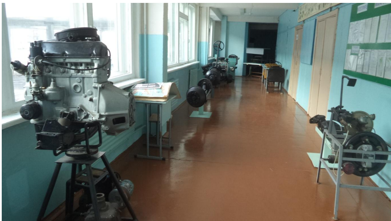
Учебная аудитория, оборудование, информационный уголок