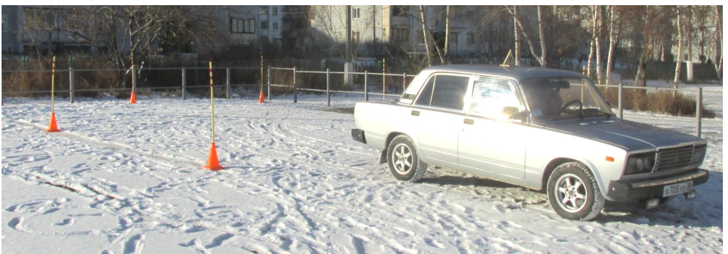
Учебное упражнение «Разворот в дворики»