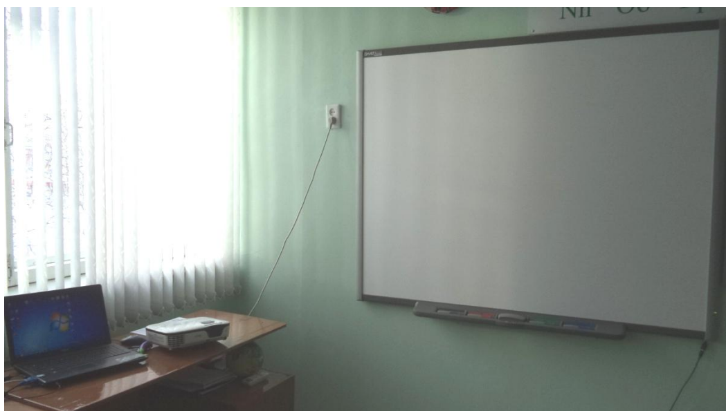
Кабинет информационных технологий № 27. Интерактивная доска