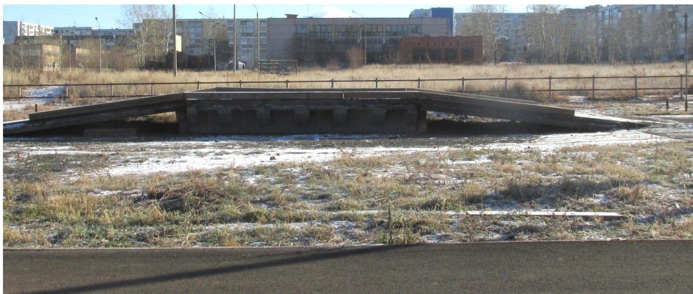
Наклонный участок (эстакада) с продольным уклоном относительно поверхности закрытой площадки в пределах 9 градусов.