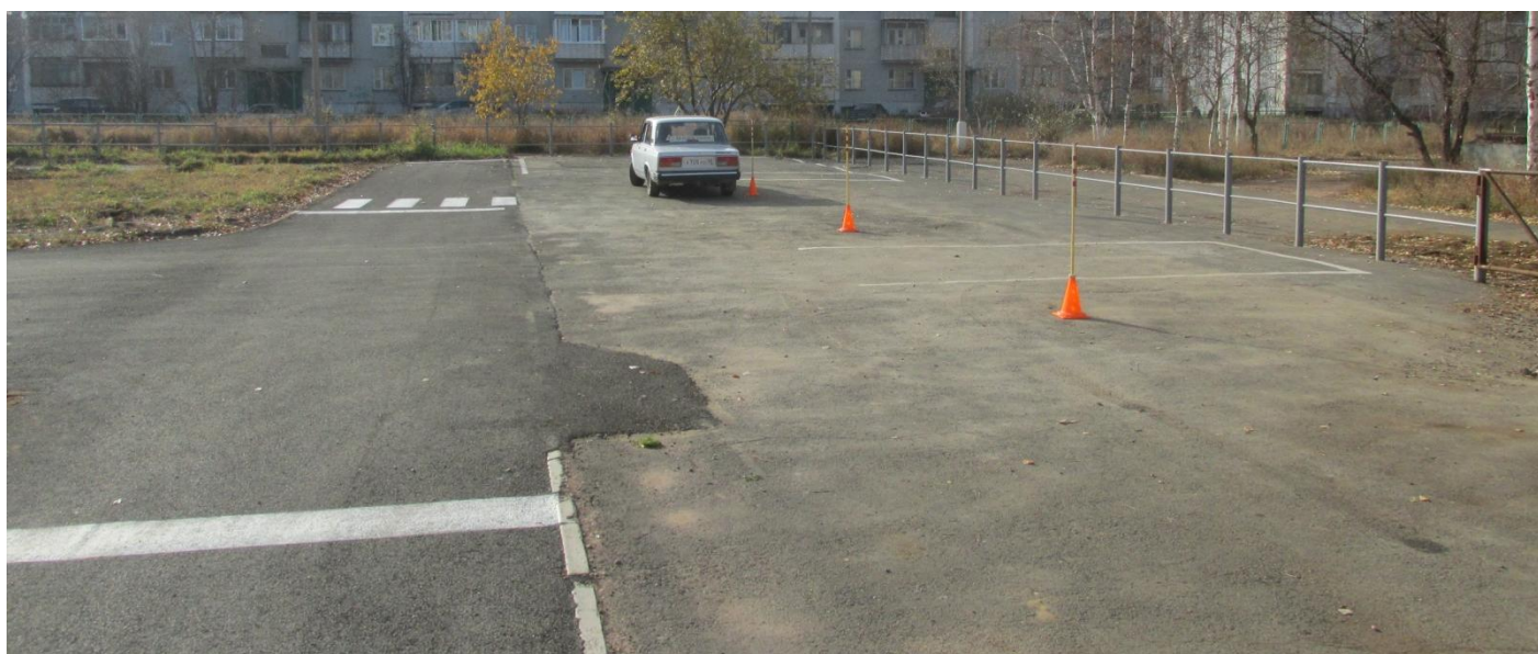
Учебное упражнение «Змейка передним ходом»