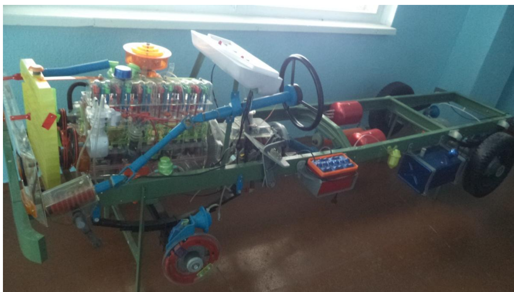
Интерактивный макет автомобиля (электроника, оргстекло)