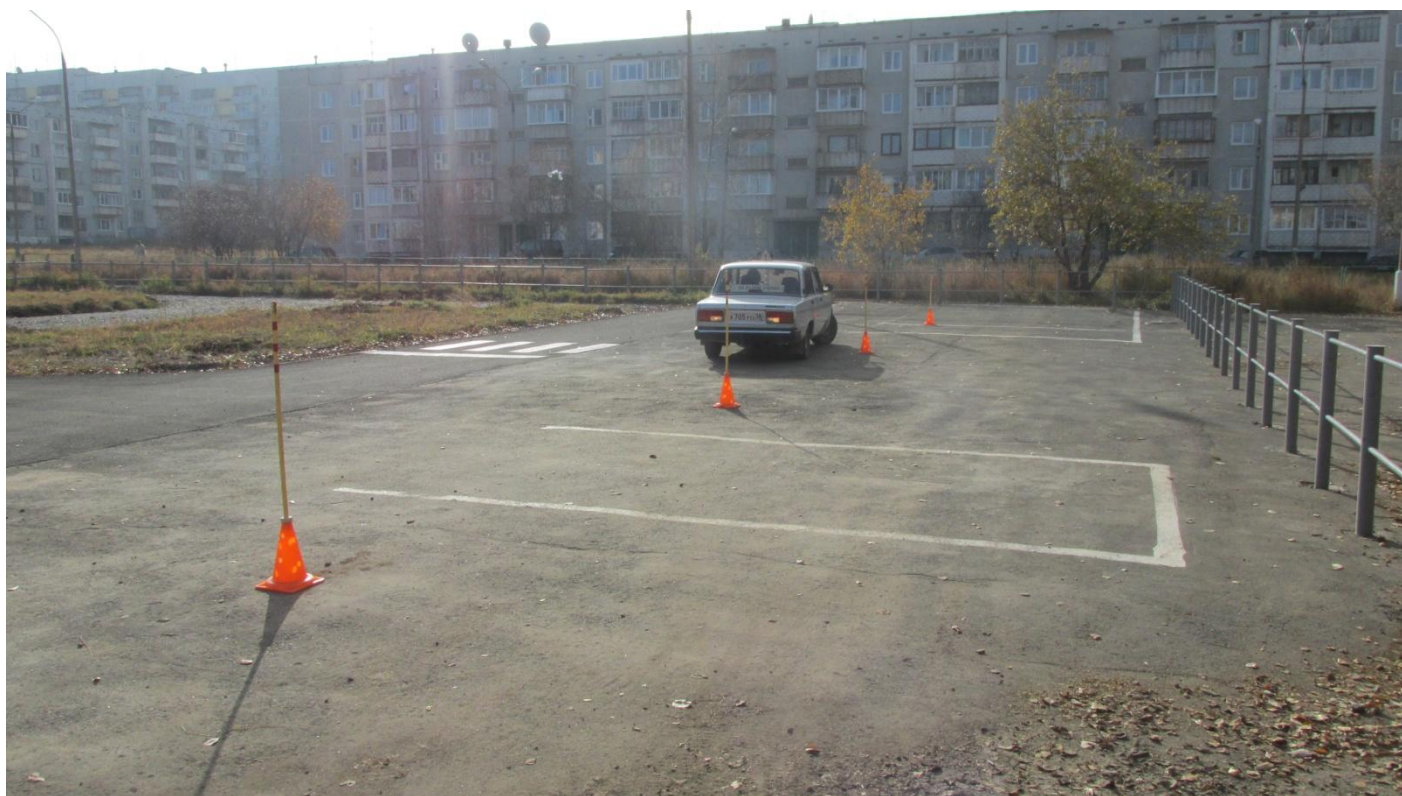
Учебное упражнение «Змейка задним ходом»