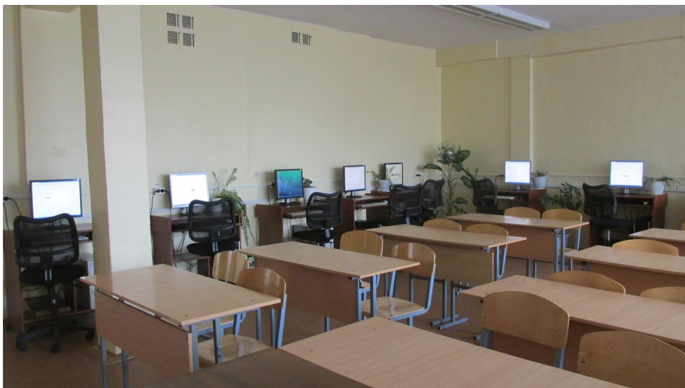
Кабинет информационных технологий. 15 посадочных мест