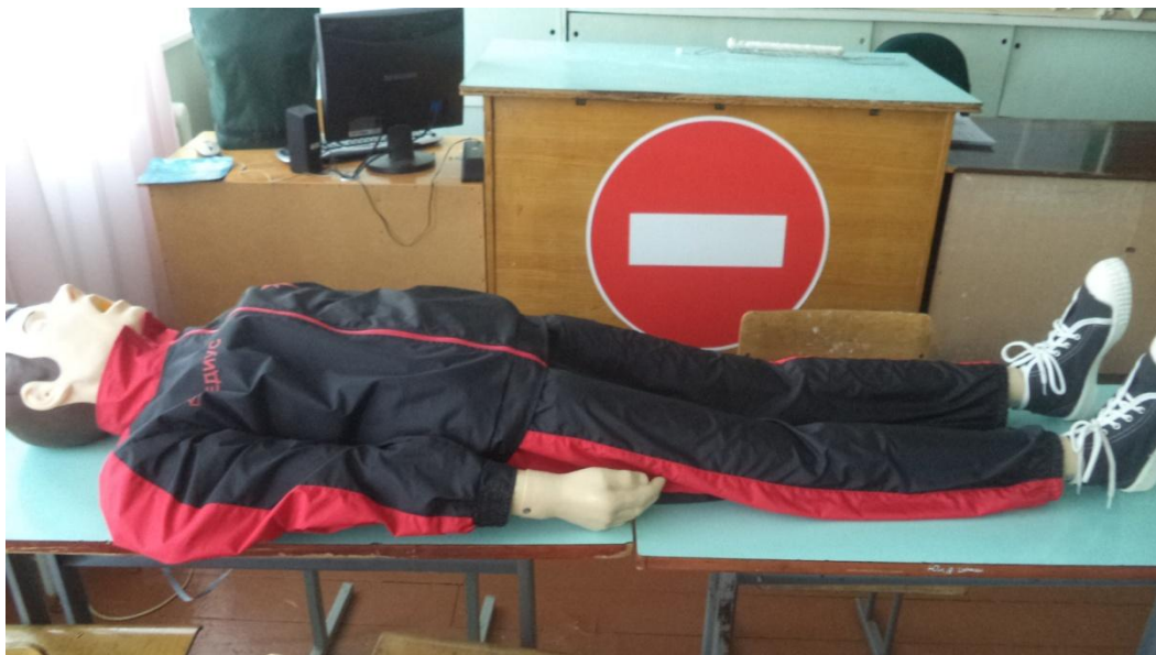
Тренажер-манекен взрослого пострадавшего для отработки приемов удаления инородного тела из верхних дыхательных путей