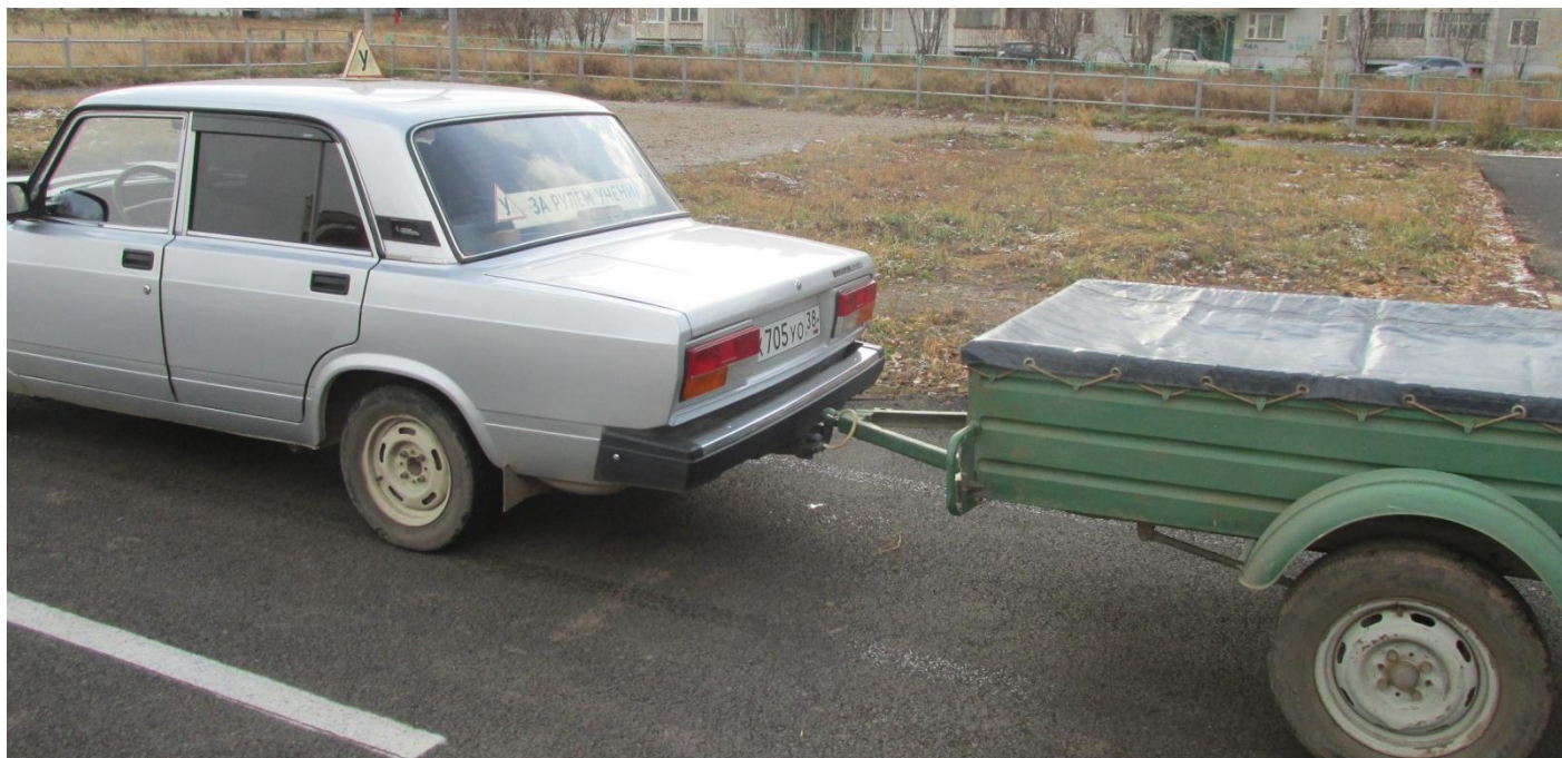
Прицеп, максимальная масса которого не превышает 750 кг.