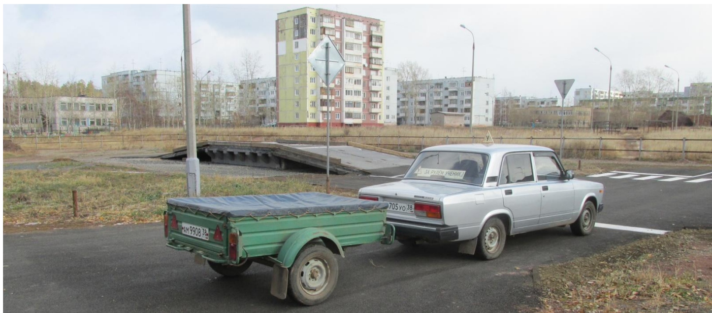
Закрытая учебно-тренировочная площадка. Автомобиль ВАЗ 2107 с прицепом