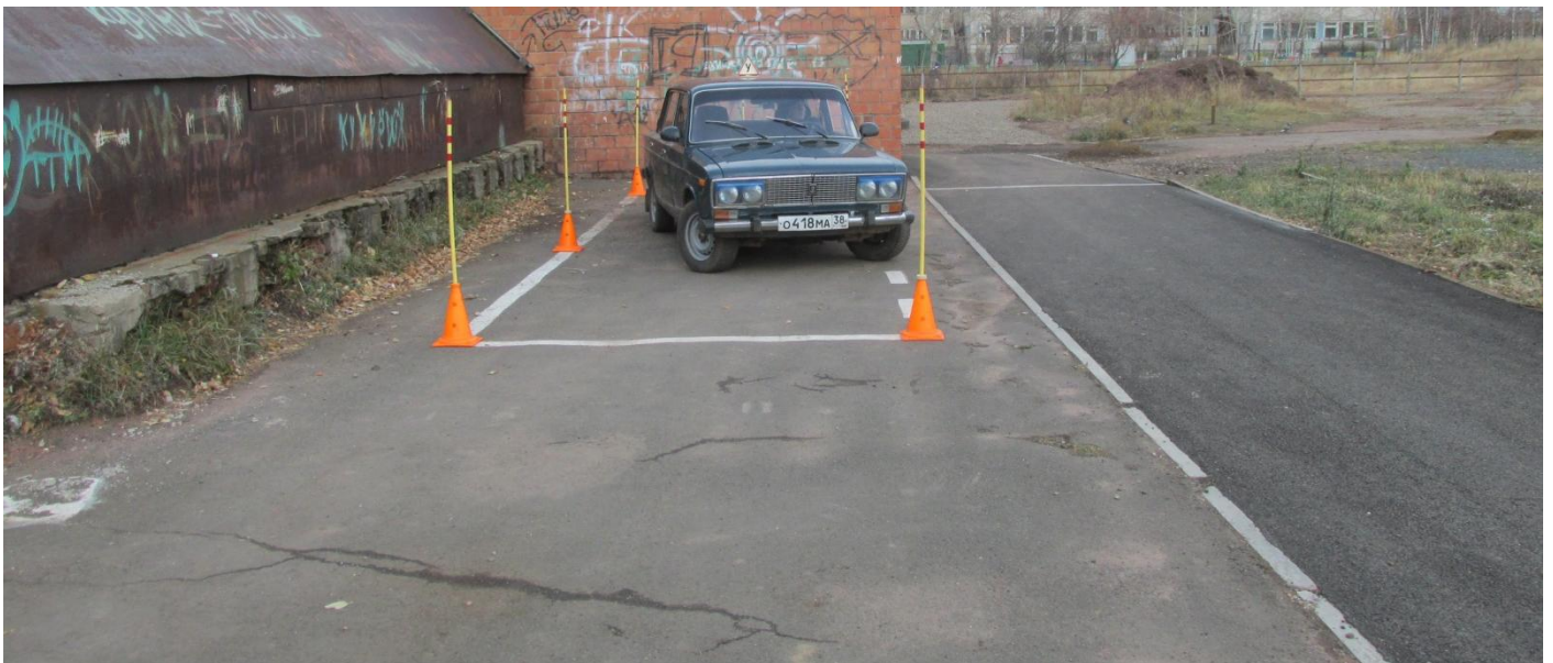
Учебное упражнение «Параллельная парковка»