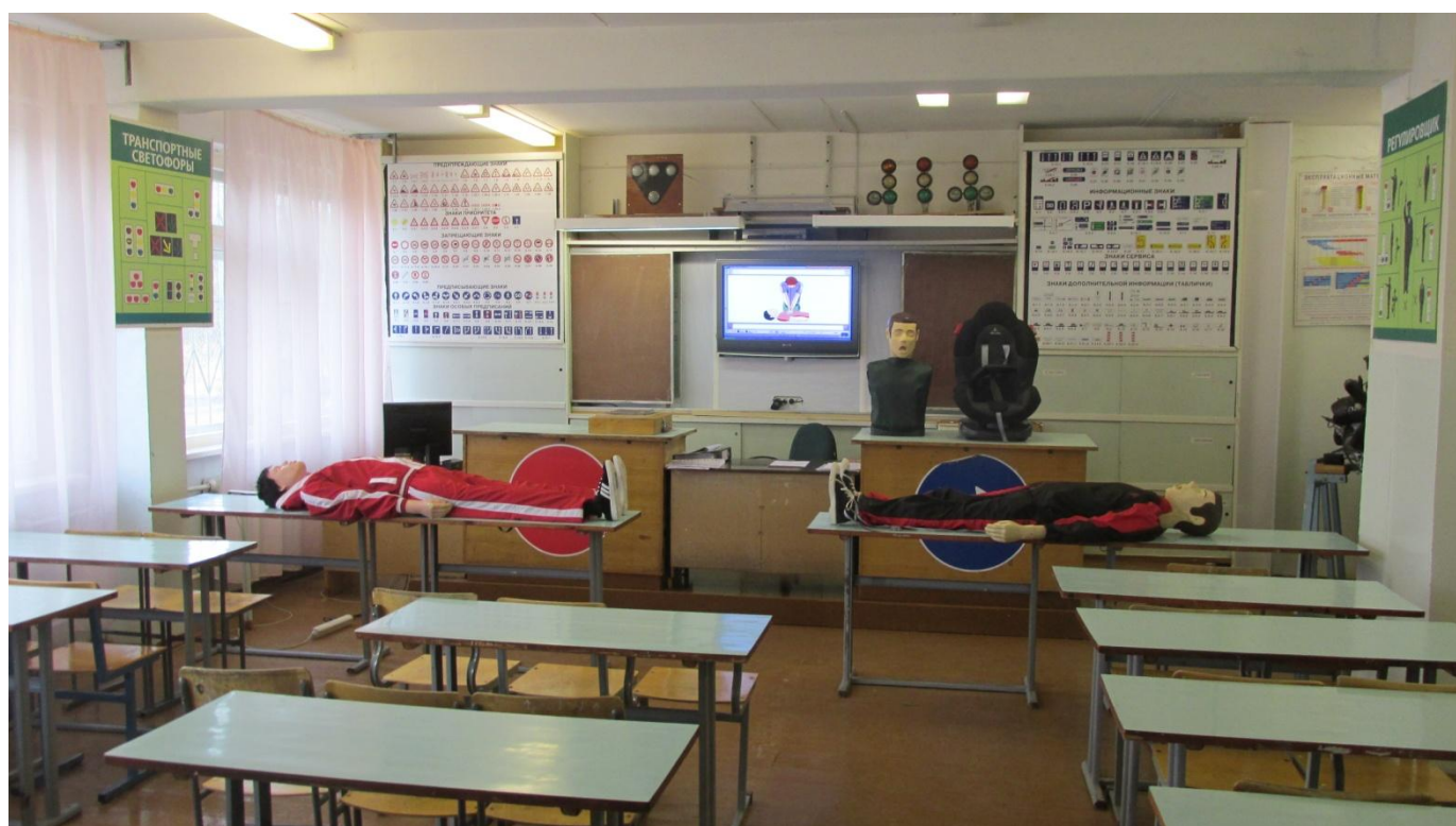
Передняя стенка автокласса. Раздвижная доска. Плазменный экран