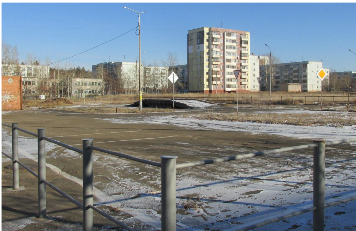
Закрытая учебно-тренировочная площадка МБОУ «Лицей № 2». Эстакада. Освещение. Разметка