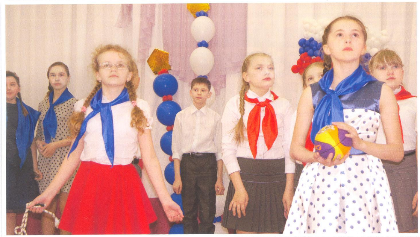
Театральная постановка юных актёров