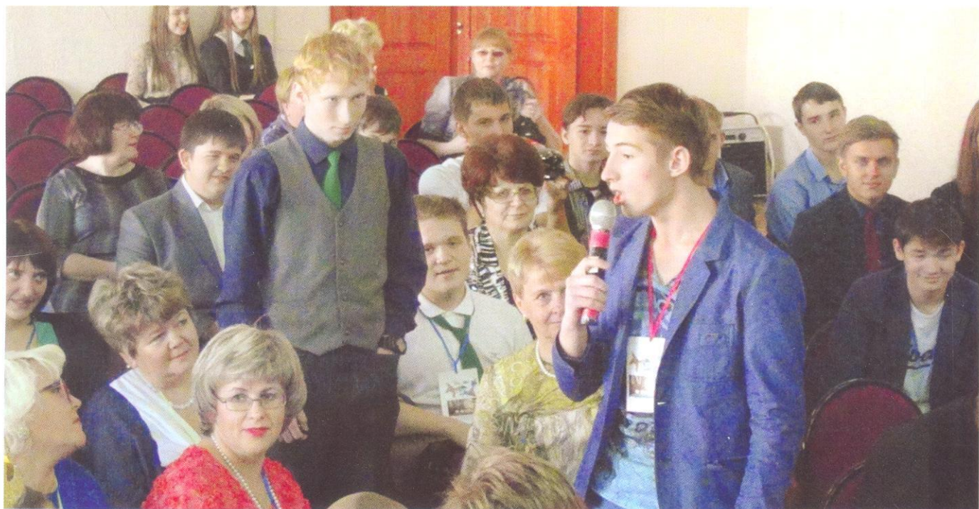
Во время дебатов на переговорной площадке

Удовлетворённость качеством образования (учащиеся – 75 %, родители – 85 %) подтверждают наряду с ежегодными опросами и отзывы выпускников, учащихся, родителей, гостей в книге отзывов, ставшей в 2015–2016 учебном году интерактивной на официальном сайте лицея http://lyceum2.ru .