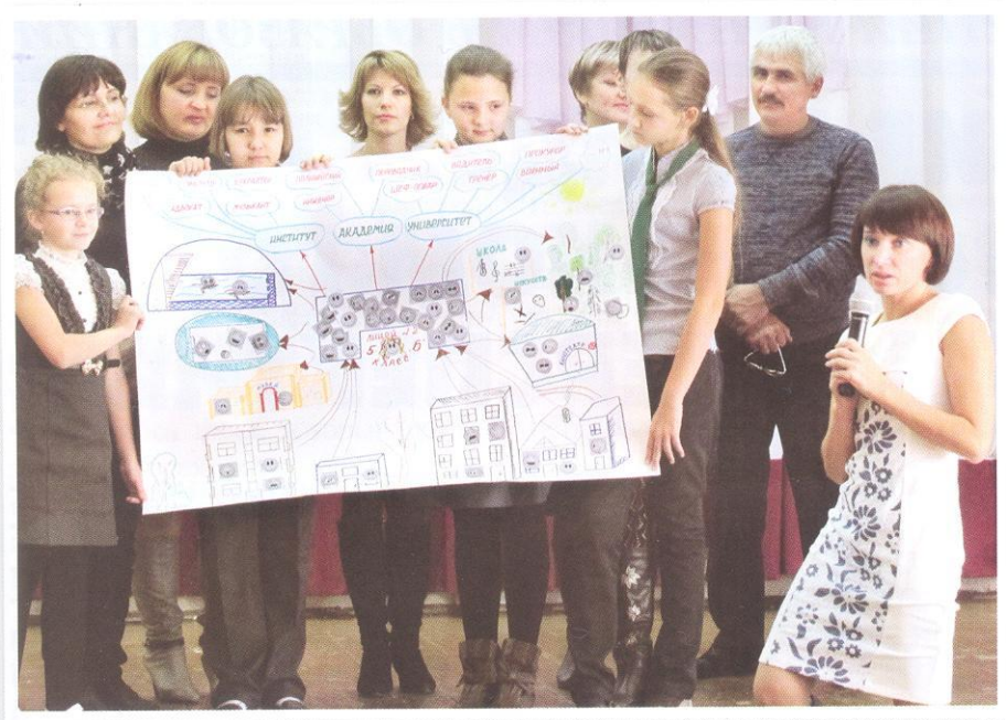
Родительский актив в действии

приятными города в направлении профориентации.