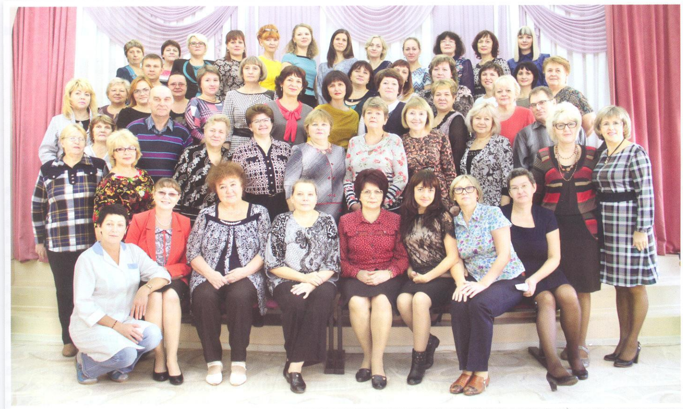
Педагогический коллектив лицея № 2 г. Братска

сотрудничество старших и младших лицеистов.