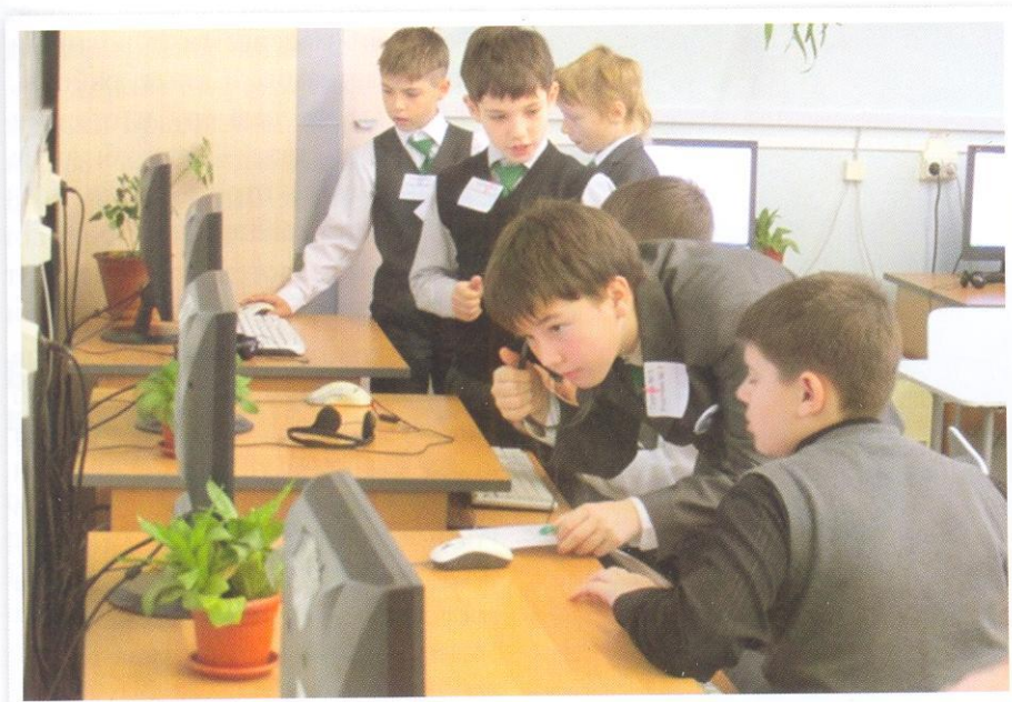
В информационной лаборатории

Ежегодный анализ результатов, описание проблем и перспектив качества управления образовательной системой МБОУ «Лицей № 2» подтверждают воспроизводимость («уживчивость») процессов, внутреннюю эффективность системы документирования, развитие ресурсов, системы взаимодействия с партнёрами, открытость лицея, способность высшего руководства к рефлексивному управлению, а главное, стремление к гибкости системы качества (реагированию на вызовы и результаты) как вершине системы управления.