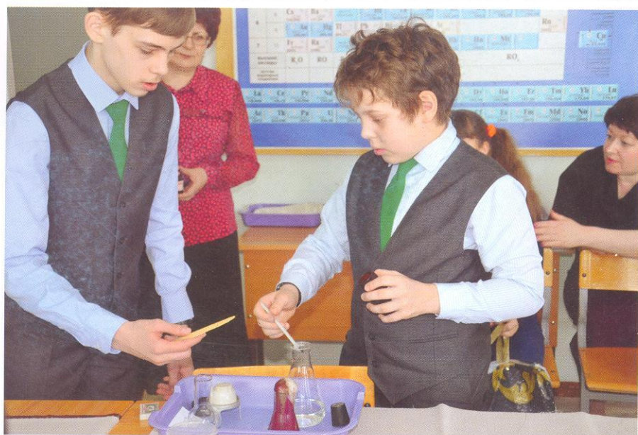
Занятие в лабораторных условиях

В части «совокупного действия» наши педагоги наряду с участием в реализации плана научно-методической работы, повышением