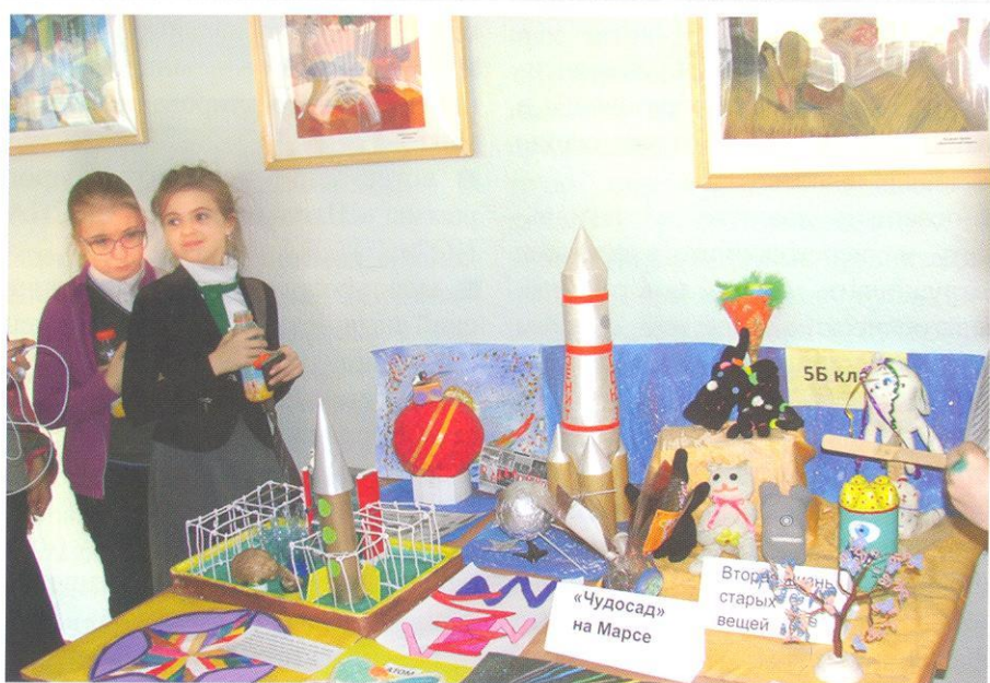
Участницы «Недели науки»

В сравнении с данными прошлого года на 10 % увеличилось количество родителей, запрашивающих проектно-исследовательскую деятельность детей и работу с информацией.