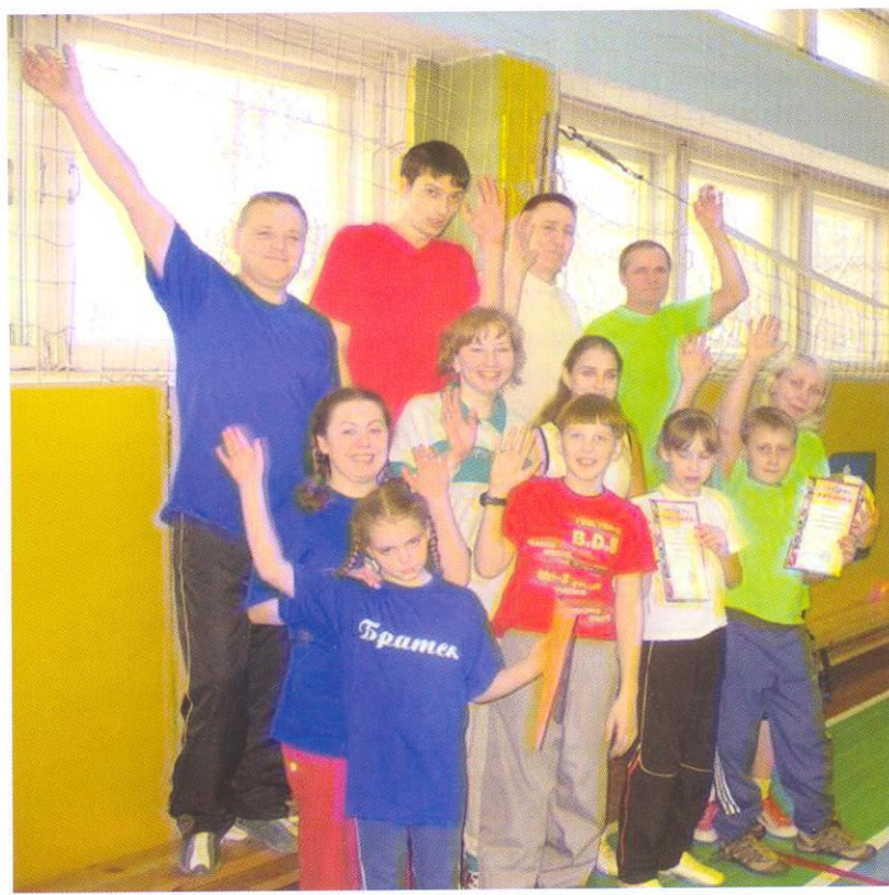
Активный отдых – дело хорошее!