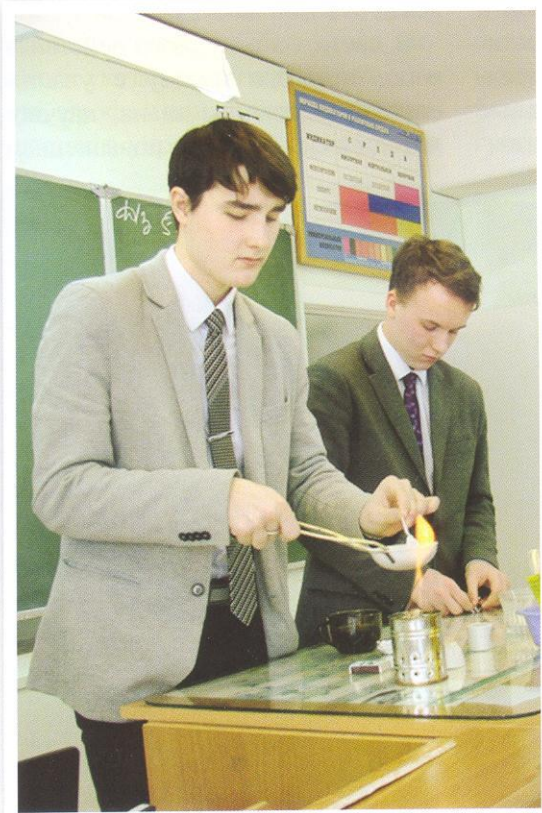
Старшеклассники проводят опыты