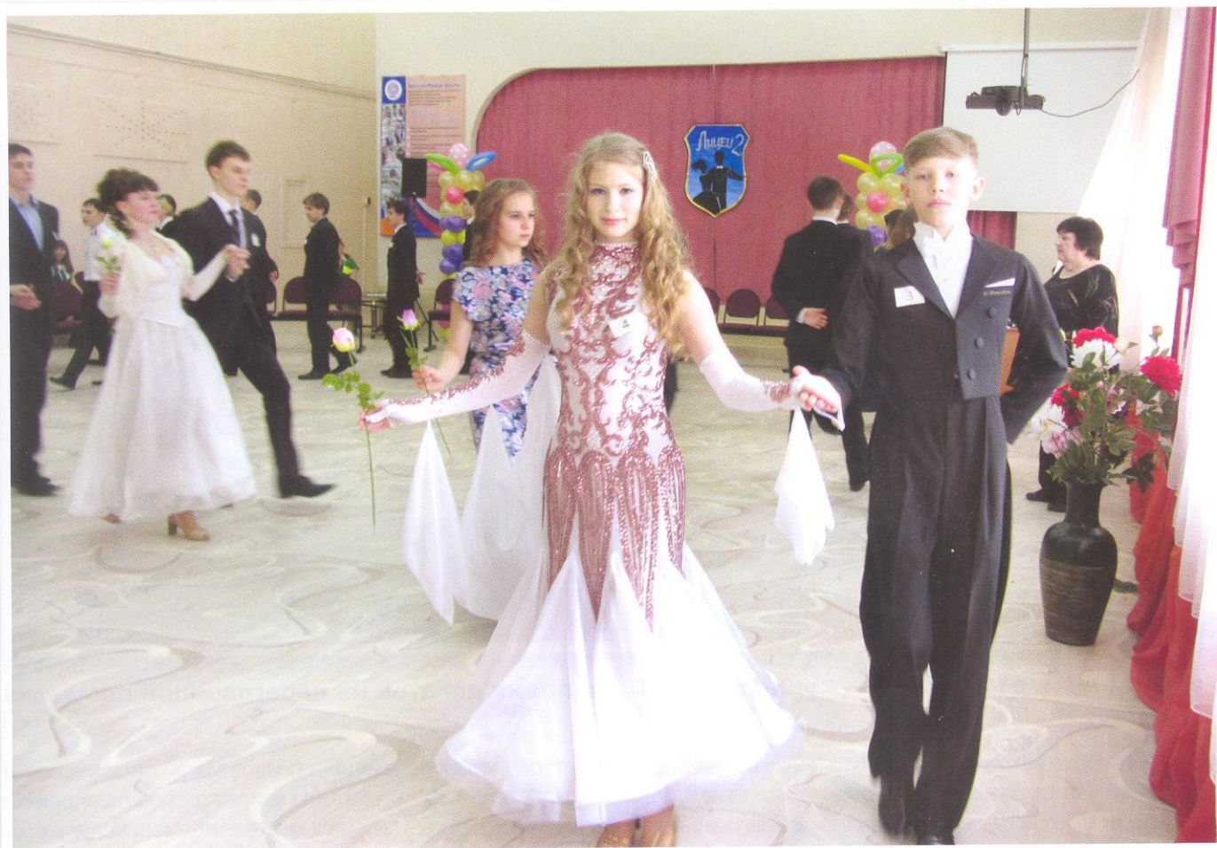
На чарующем лицейском балу