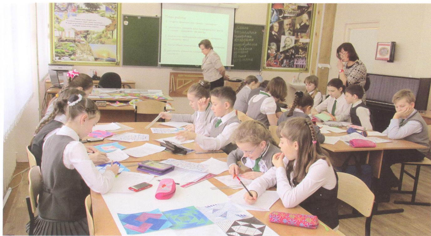
Работа над проектом

день открытых дверей МБОУ «Лицей № 2» уверенно подтверждают высокий рейтинг, положительную репутацию и благонадёжность лицея среди жителей города. На вопрос «Если у Вас есть реальная возможность выбирать, в какую школу отдать ребёнка, то почему вы выбираете именно лицей?» первые позиции занимают следующие ответы: