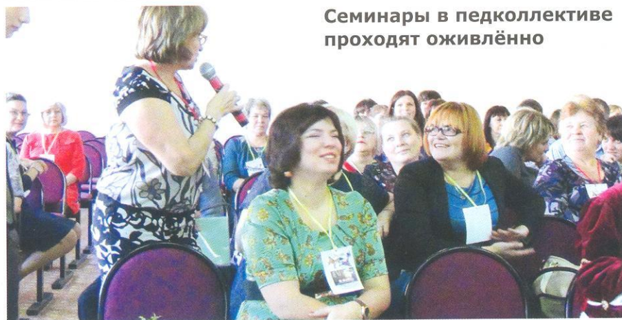
Семинары в педколлективе проходят оживлённо