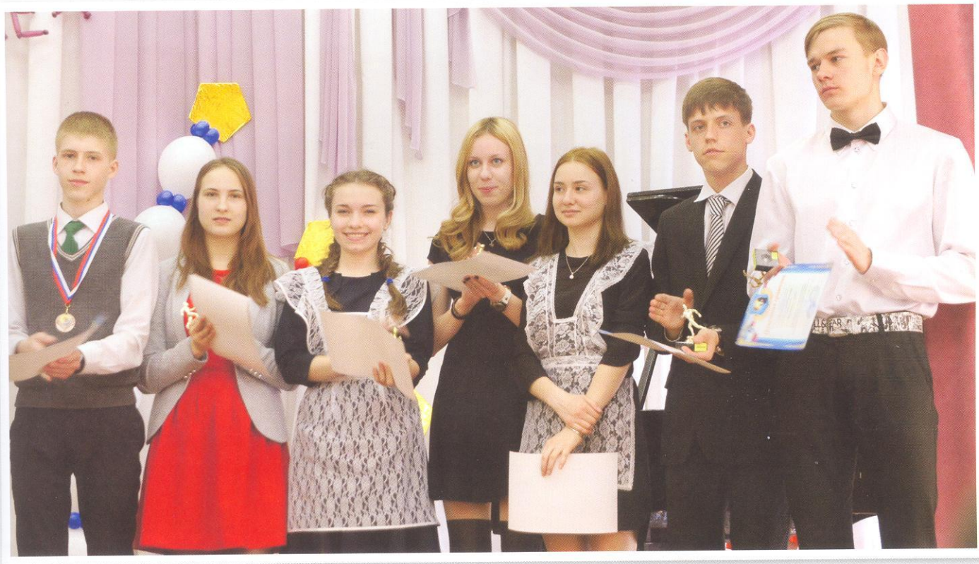
«Как здорово, что все мы здесь сегодня собрались!»

ние ежегодного отчёта о результатах совместной деятельности с МБОУ «Лицей № 2».